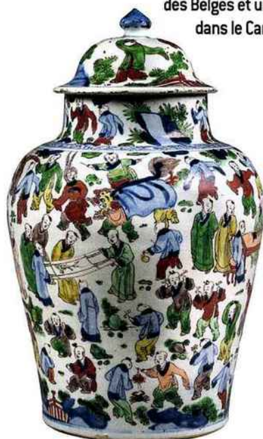
Vase et son couvercle en porcelaine à décor des « Cent Enfants » en wucai (cinq couleurs), Chine, époque Shunzhi (1644-1661).

Les vingt et un exposants soigneusement sélectionnés du Parcours de la Céramique et des Arts du feu, parmi lesquels des Belges et un Londonien, se déploient tous cette année dans le Carré Rive Gauche du 6 au 14 septembre.