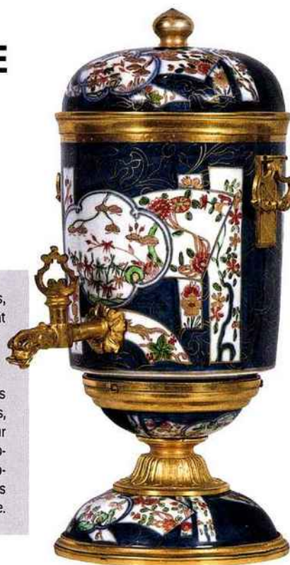
Fontaine à parfum en porcelaine Imari (Japon, Edo) et monture en bronze doré (France, XVIII e siècle). H. 28 cm, D. 12 cm.