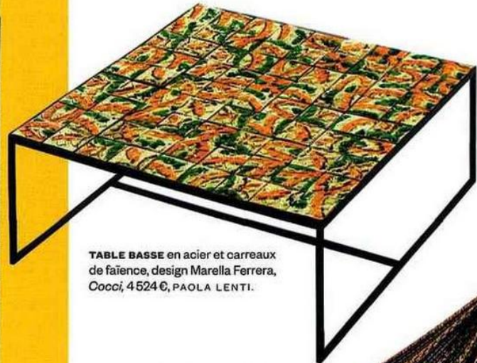
TABLE BASSE en acier et carreaux de faïence, design Marella Ferrera, Cucci, 4 524 €, PAOLA LENTI.

TISSU OUTDOOR en acrylique, collection Icon, Pioneer Sunrise , en rouleau de 137 cm de l, prix sur demande, SUNBRELLA.