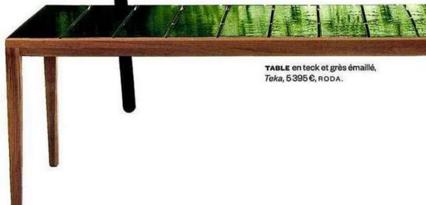
TABLE en teck et grès émaillé, Teka , 5 395 €, RODA.

CHAISE en métal brossé, design Studio BrichetZiegler, Weekend , 222 €, PETITE FRITURE.